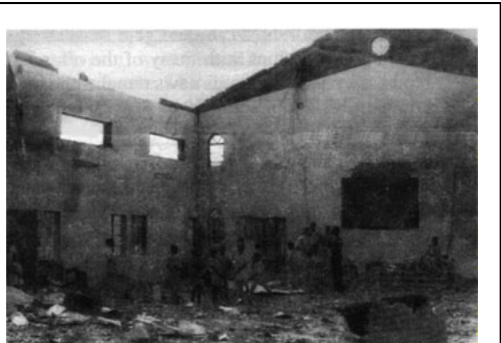
Une église des Églises évangéliques de l'Afrique de l'ouest a été brûlée par des intégristes islamiques à Zaria au Nigéria.

Dans la province de Shaanxi, en Chine: "Les officiers devêtirent trois frères jusqu'à la taille et forcèrent les femmes à se tenir avec eux... Les trois hommes furent battus jusqu'à ce qu'ils furent totalement couverts de sang. Ils avaient des blessures béantes et des plaies à la grandeur de leurs corps. Comme une raclée aussi violente ne leur suffisait pas, les officiers alors les firent suspendre à des cordes et les rouèrent de coups de verges sur le dos.